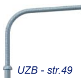
UZB - str.49

Počet ramen výložníku a jejich délka vyložení je stanovena v závislosti na výšce dřívku stožáru a jeho celkovém zatížení (hmotnost a plocha vlastního výložníku včetně použitých svítidel).